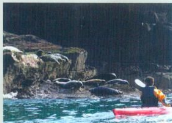
Vi kommer helt tæt på en koloni af gråsæler